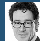
Norbert Kuiper Management Consult. Verdonck, Klooster & Associates